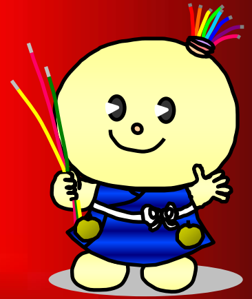
イメージキャラクター ちようじゃ リード長尺くん

リード線をご指定の長さにカットいたします。先端の加工もおまかせください。材料は当社がご用意します。御社は注文するだけでOKです。